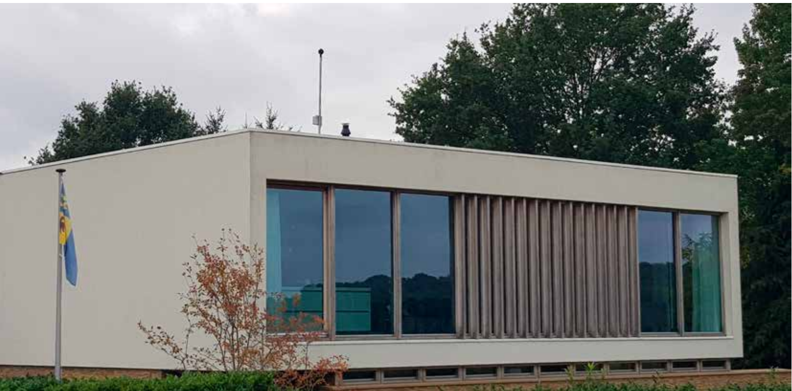
Meetlocatie UB019 De Damiaan Meerssen