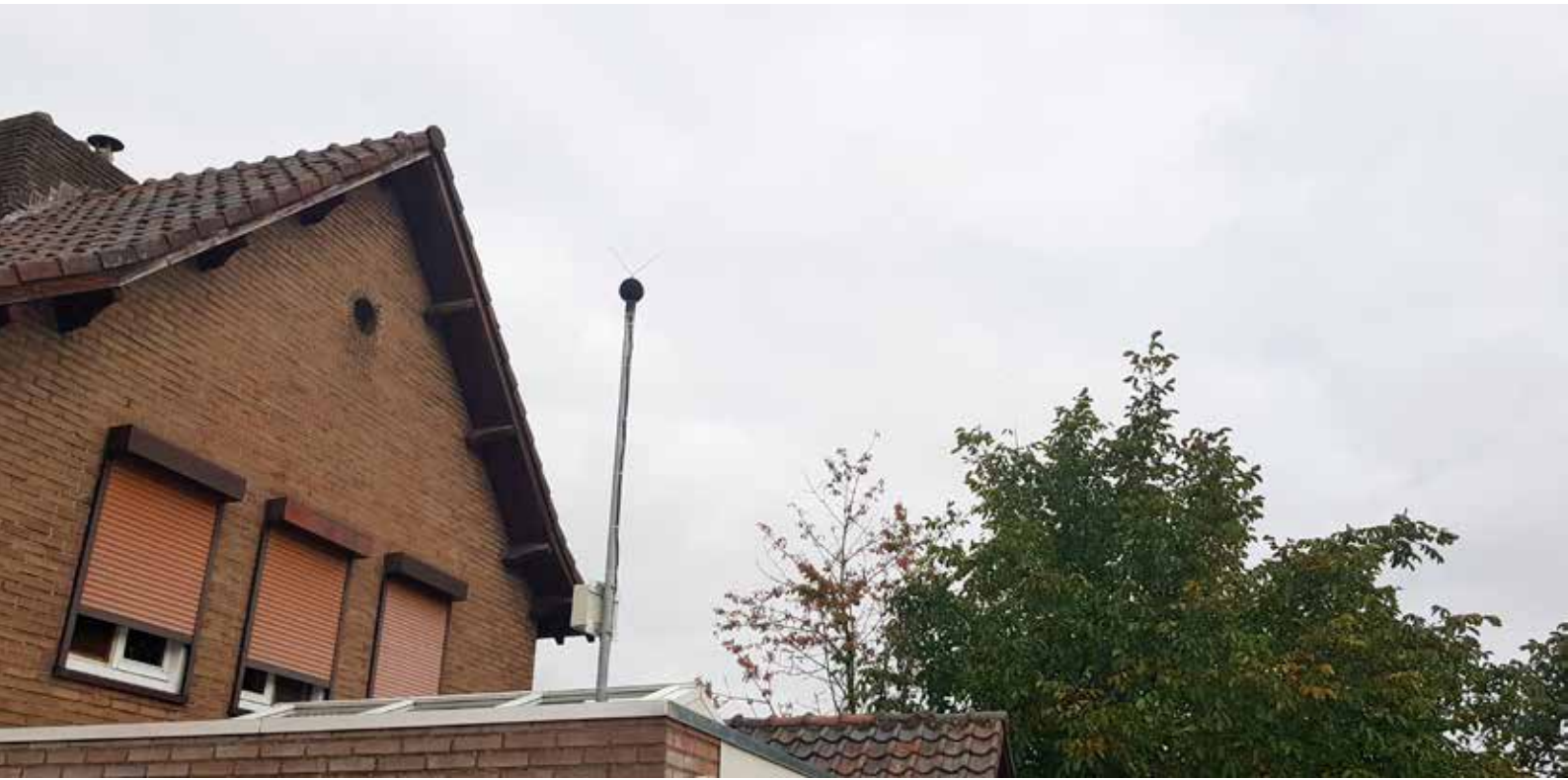
Meetlocatie UB033 Kelmonderstraat Beek