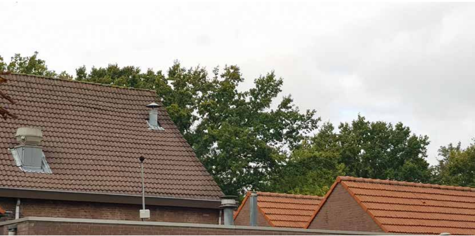
Meetlocatie UB021 Pastoor Geelenplein